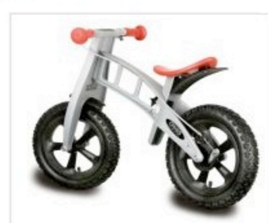
też zakup rowerka.

Na maratonie Poland Bike w Serocku do Chatki Małolatka dołączy FIRST BIKE , który będzie towarzyszył nam już na każdym maratonie! Zapewni emocjonujące zawody dla najmłodszych (w kategorii 2-4 lata) oraz inne ciekawe zabawy. Podczas maratonu maluchy będą mogły nie tylko pojeździć na tym najbardziej popularnym w Europie Zachodniej rowerku bez pedałów, ale również wygrać go jako jedną z nagród! Sponsorzy zapraszają też rodziców, aby porozmawiać o tym innowacyjnym produkcie i nowej, całkowicie naturalnej metodzie nauki jazdy. Możliwy będzie